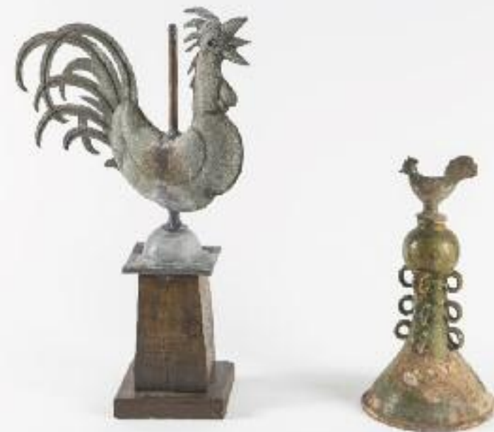
BEL ENSEMBLE D'EPIS DE FAÎTAGE, TUILES FAÎTIÈRES...