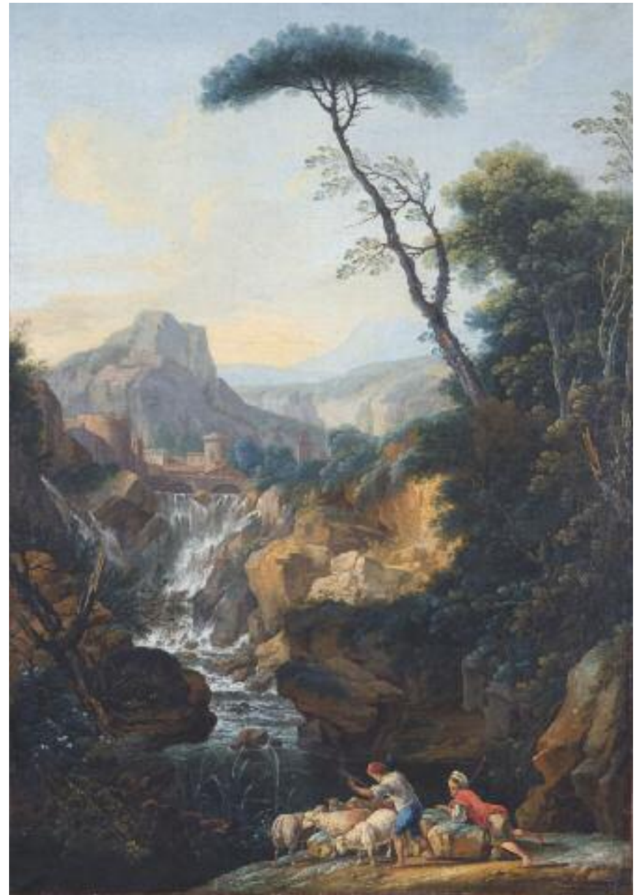
Attribué à Luigi Domenico SOLDINI, né en 1715 Paysage italien avec une cascade, animé de bergers et de leur troupeau de moutons Huile sur toile, rentoilée 113 x 80 cm