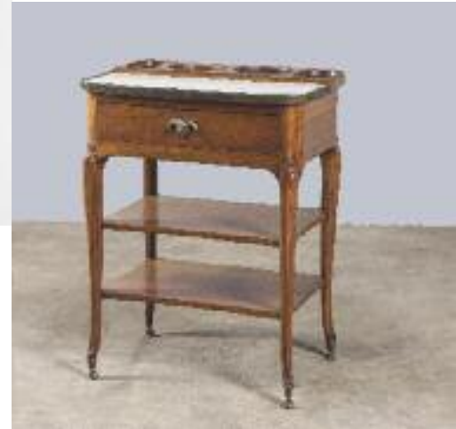
Table dite "à la Tronchin"

en acajou massif ouvrant à un tiroir en ceinture. Elle repose sur quatre pieds galbés aux pans décreusés, réunis par deux plateaux d'entretoise et terminés par des sabots à roulette Dessus de marbre blanc et deux réceptacles à bouteilles Style Louis XVI - XIX e siècle, dans le goût de CANABAS Haut. 77 cm - Larg. 60,5 cm - Prof. 45,5 cm