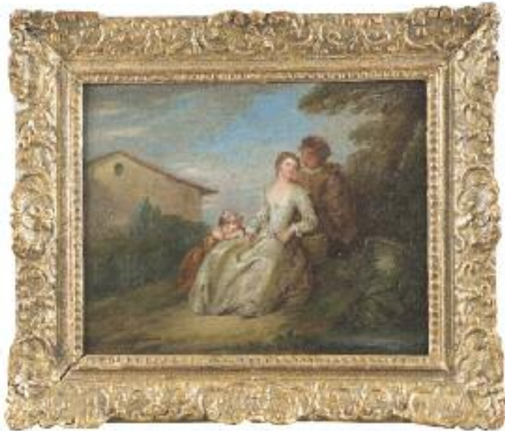
Ecole Française du XVIII e , suiveur d'Antoine WATTEAU Jeune couple et enfant dans un paysage Huile sur toile, rentoilée 33,5 x 41 cm