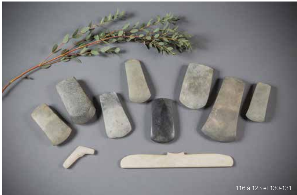
116 à 123 et 130-131