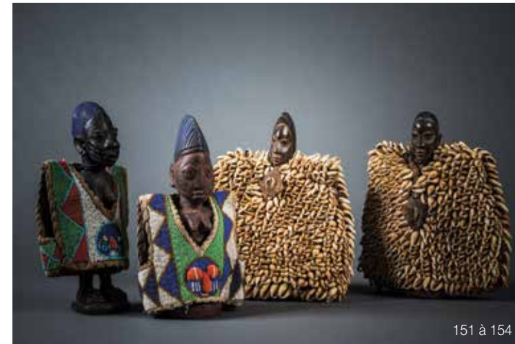
151 à 154