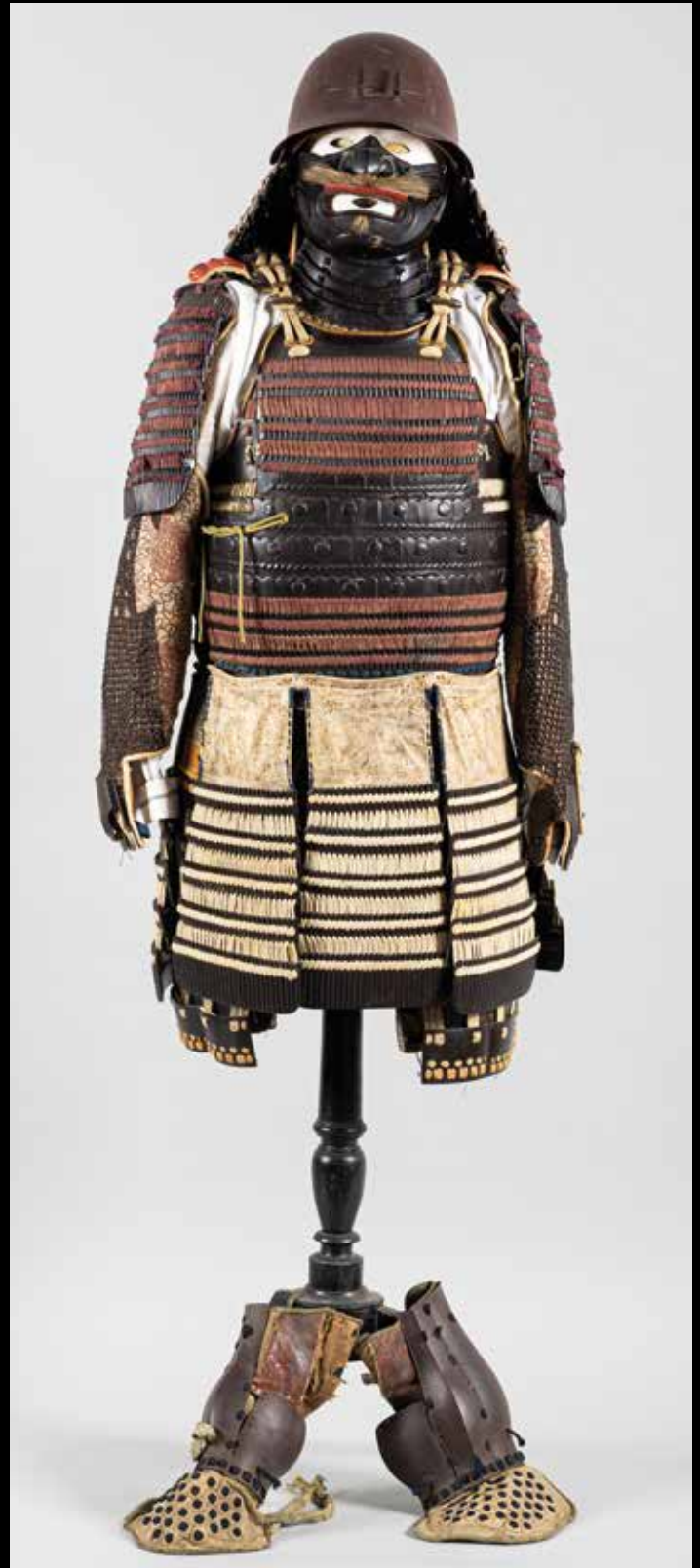
ARMURE DE SAMOURAÏ porte-étendard. Hauteur : 110 cm. (+ 33 cm de jambières) Japon. Deuxième moitié de la période Edo. Fin du XVIII e siècle.