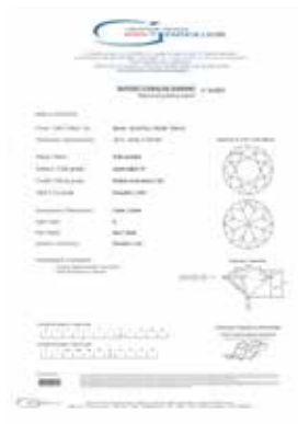
31 Exceptionnel diamant 8.64 carats. Certificat LFG n° 314257 Vendu sur désignation 60000/80000€