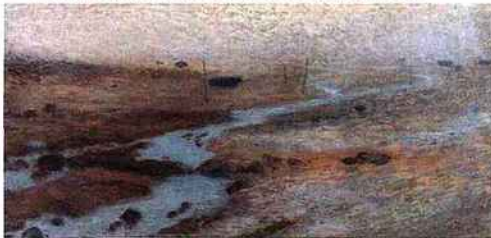
Henri Martin « Barques à marée basse », vers 1900-1910