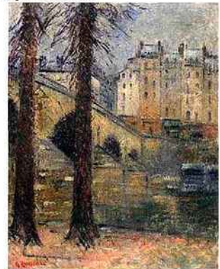
Gustave Loiseau, « Le Pont Marie » à Paris, 1925

Rennes Enchères met aussi en lumière quelques figures marquantes de la scène artistique parisienne des XIX ème et XX ème siècles.