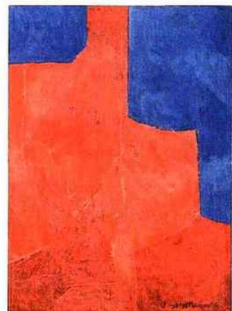
Poliakoff, « Composition abstraite », 1961

Figure majeure de l'Ecole de Paris, POLIAKOFF, virtuose de la balalaïka et du pinceau est un coloriste inspiré. Ses peintures abstraites sont pensées, méditées, ressenties, telle cette gouache de 1961 (n° 74 : 25 000/35 000 €). Les formes à la géométrie tempérée s'imbriquent à la façon d'un puzzle, vivifiées par les contrastes de bleu et de rose qui donnent rythme et musique à la composition.