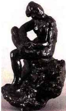
Pierre Bonnard « Baigneuse au rocher », bronze

Célèbre sculpteur animalier, BARYE a une prédilection pour les combats d'animaux sauvages. Au marbre, il préfère la patine du bronze. Des œuvres saisissantes de vérité et de puissance tels « L'éléphant du Sénégal » (n° 9 : 7 000/10 000 €) et « Le taureau attaqué par un tigre » (n° 10 : 6000/9000 €). Ces deux bronzes de belle facture portent le cachet d'or du fondeur BARBEDIENNE. Peintre, BONNARD s'est adonné à la sculpture sur les conseils d'Ambroise VOLLARD. Il suggère plus qu'il ne décrit, avec beaucoup d'expression (n° 21 : Baigneuse au rocher : 22 7 000/12 000 €).